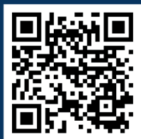
Vrcholy a místa

Tak neváhejte, naplánujte si trasu a vydejte se na nezapomenutelné putování!